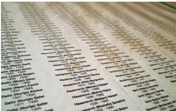
Il Memoriale alle vittime di Srebrenica (BiH).