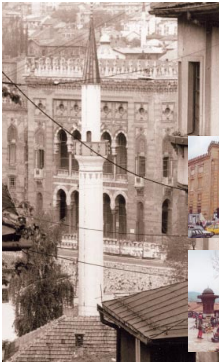
BASCASIJA – centro storico di Sarajevo

Tra i momenti più rilevanti quello appunto della presentazione dell'Appello a favore dell'integrazione certa, rapida e sostenibile dei Balcani in Europa. "Perché" – ha ricordato il Presidente della Commissione europea Romano Prodi – "l'unica prospettiva di futuro per i Balcani sta nell'Europa, ed è ora venuto il tempo di definire la via e le tappe per un serio percorso di avvicinamento". Mauro Cereghini, coordinatore dell'Osservatorio sui Balcani, ha aggiunto che "si tratta di un Appello ambizioso, che pone un obiettivo alto ma necessario: l'ingresso di tutti i paesi dell'area sud-orientale nell'Unione Europea, con tempi certi, con forme sostenibili e con percorsi che coinvolgano le intere comunità e non solo i loro rappresentanti ultimi" – aggiungendo poi che – "piccole patrie e grandi orizzonti possono convivere solo dentro un contenitore ampio e plurale, come di fatto è l'Europa, ovvero" – rivolgendosi con lo sguardo direttamente al Presidente della Commissione Europea – "con una metafora che le sappiamo cara, un'unione di tante minoranze".